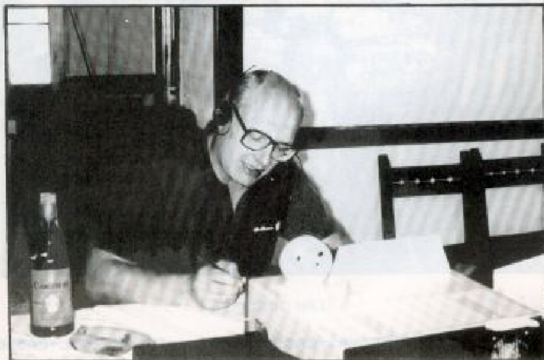
OH0XX, O111, OPERANDO EDBACH DURANTE EL CQ WORLD WIDE WPX SSB DE 1991

También es interesante señalar que las placas que se otorgaban a los aficionados de España e iberoamerica se amplian también al Principado de Andorra, Portugal, Madeira y Azores.