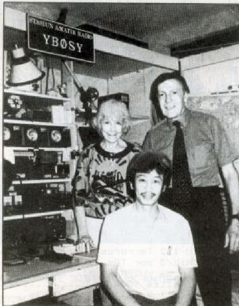
LOS COLVIN SON ACTUALIDAD CON SU VIAJE POR ASIA. EN LA FOTO EL MATRIMONIO CON YBOSY HACE TRES AÑOS.

-DINAMARCA. A partir del 1 abril, las estaciones OZ podrán utilizar la banda de 160 metros en el segmento comprendido entre 1820-1850.