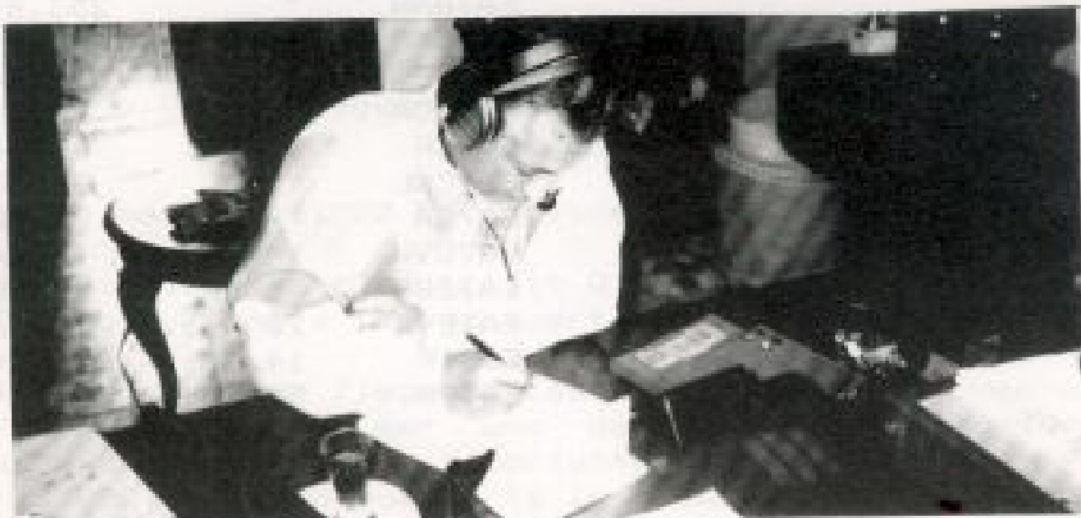
EABAFS OPERANDO EDBACH DURANTE EL CQ WW WPX SSB-91