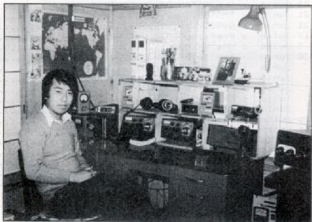
JR1AIB, DESTACADO DXer JAPONES.

RECUERDA QUE TODAS LAS HORAS QUE FIGURAN EN ESTE BOLETIN SON G.M.T.