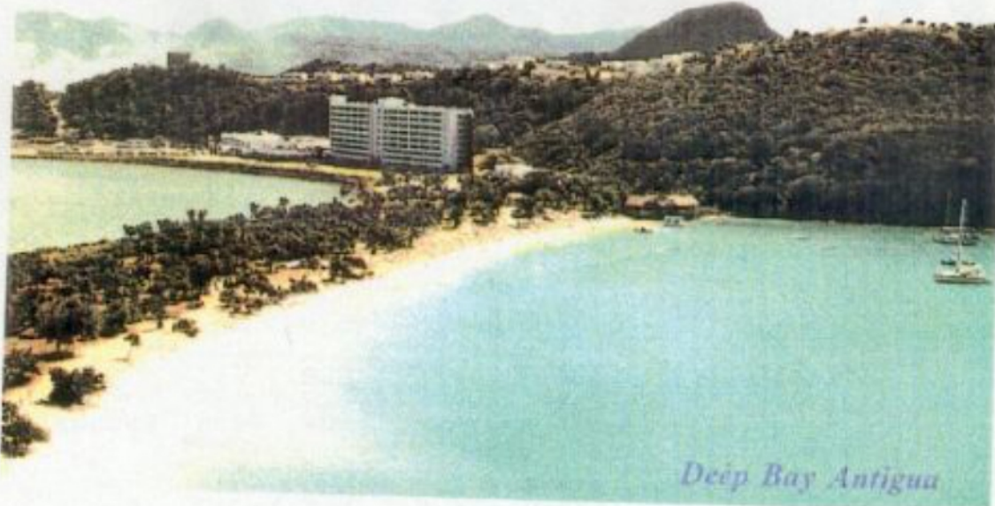
Deep Bay Antigua